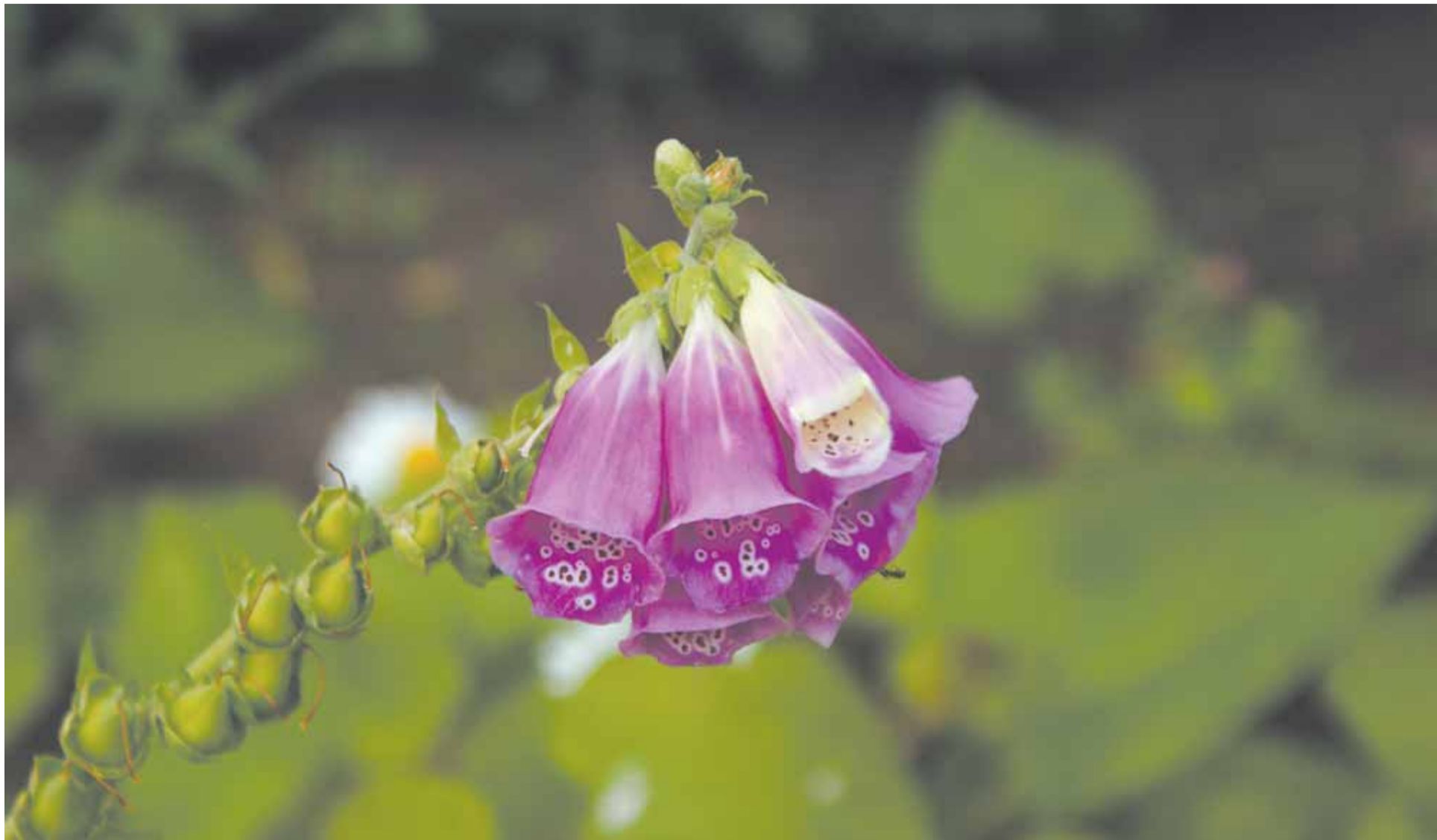
Örten Digitalis kan bota hjärtsvikt och förmaksflimmer men är också mycket giftig.