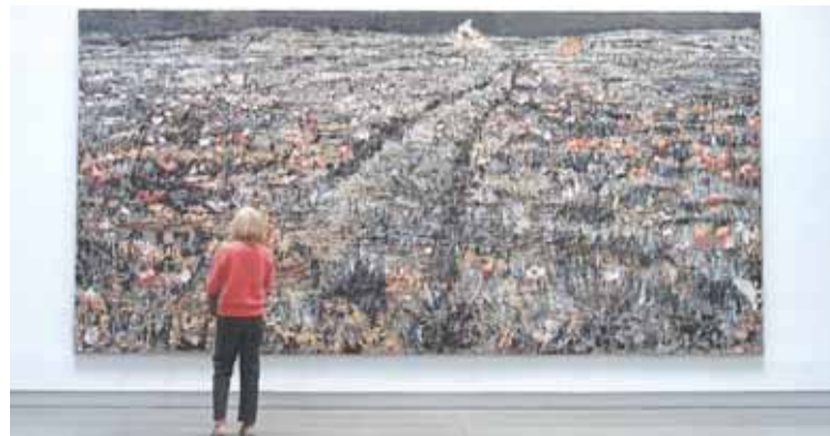
Böhmen liegt am Meer , 1995. Olja på duk, 280 x 560