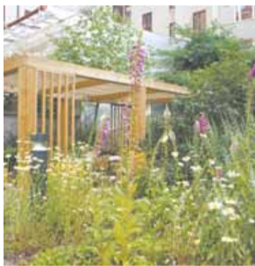
”Här på Miljömagasinet har vi en ljuvlig innegård.”

Man måste alltså vara en särskilt klok gumma för att kunna hantera Digitalis , och sådana är det numera lite ont om. Faktum är att till och med den moderna läkekonsten kan misslyckas med dosering. Medicinen Digoxin, vars verksamma ämne kommer från Digitalis (fingerborgsblommans latinska namn), kan interagera med andra mediciner och orsaka förgiftning, varnar Läkartidningen sina läsare. Särskilt äldre och kvinnor löper risk att bli förgiftade av en alltför för