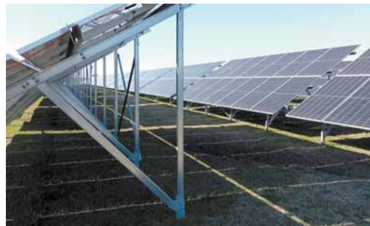
Solparken i Escobar invigdes nyligen och är den första i landet som drivs i kommunal regi.