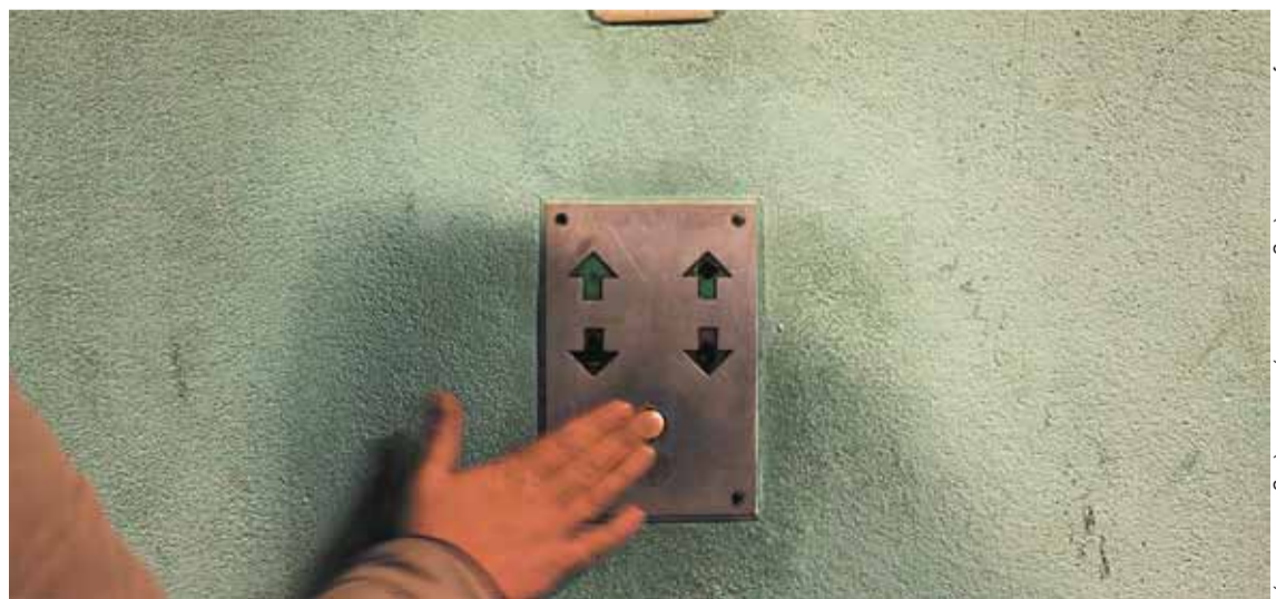
Knapptryckarna har inte haft det lätt att dela ut valsedlar i alla kommuners röstlokaler.

Knapptryckarna genomför just nu en kartläggning över huruvida Sveriges alla kommuner är villiga att distribuera valsedlar för nya partier eller inte. En lista sammanställs på hemsidan där alla kan se vilka kommuner som värnar om både demokratin och miljön och därmed grönlistas, medan övriga kommuner rödlistas. ■