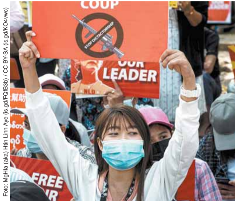
Protester mot militärkuppen i Myanmar i februari förra året. Över 14 000 har gripits och mer än 100 dömts till döden.