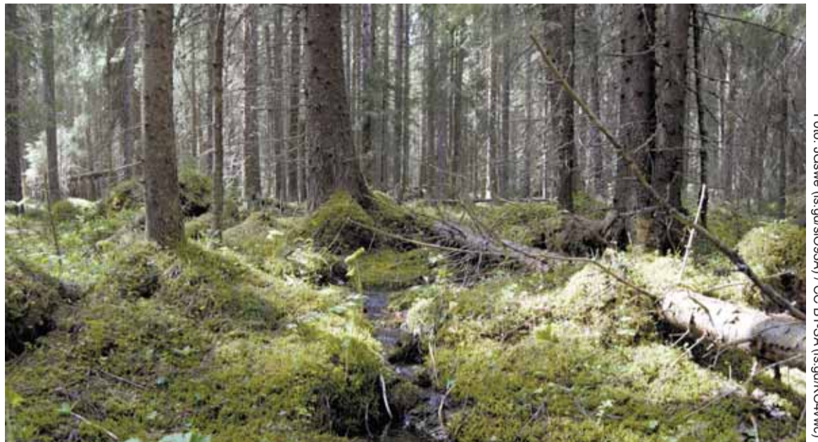
Kalkbarrskogar är en naturtyp vars bevarandestatus är dålig både i Sverige och EU i stort.

Likt det så kallade gröna avdraget ska privatpersoner och fastighetsägare kunna ansöka om skattereduktion för åtgärder som optimerar energiförbrukningen. MM