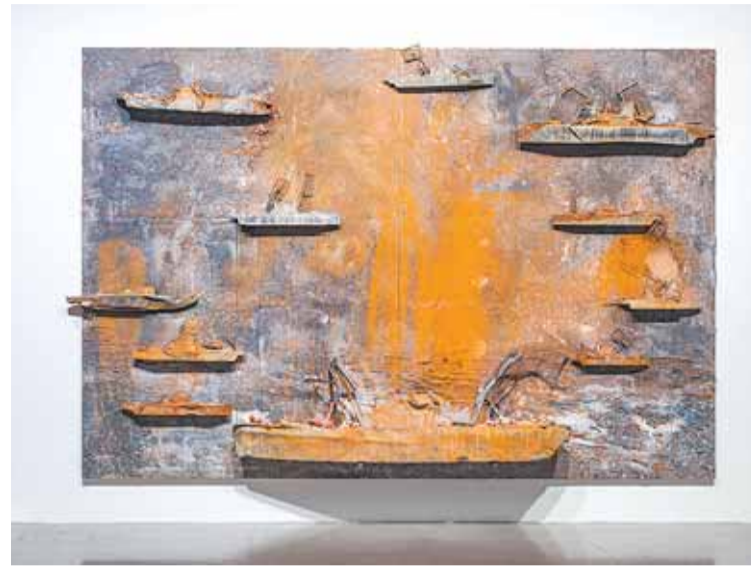
Anselm Kiefer, Voyage au bout de la nuit , 2002. Olja, emulsion, blandteknik och bly på duk, 385x560 cm

Eller som i triptyken tillika utställningstitel, Essence – Eksistence (2011), där Kiefer målat av Alperna – jo, hela bergskedjan – i ett försök att besvärja varat och