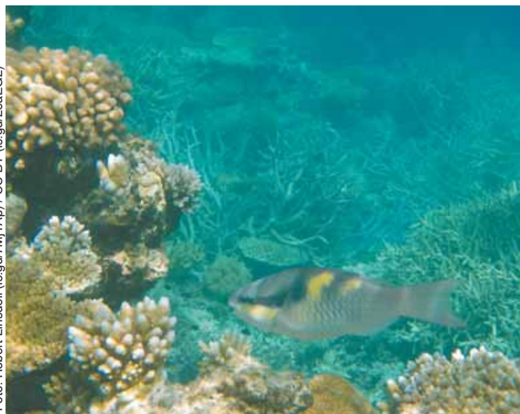
Koralltäckets över centrala och norra delarna av Stora barriärrevet är på väg att återkomma – men inte utan komplikationer.